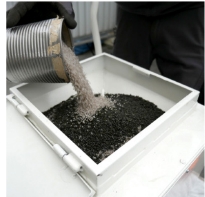
Individuell abgestimmtes Abrasivgemisch

zu beschichten. Unzählige Versuche waren nötig, bis ich endlich annehmbare Ergebnisse vorweisen konnte. Ich hatte ja absolutes Neuland betreten, selbst die Geräte und Maschinen, die wir für die Tests benötigten, wurden in Eigenregie entwickelt und hergestellt. Dank der Unterstützung eines Chemikers im freundschaftlichen Umfeld gelang es mir dann doch, eine funktionierende Rezeptur für die Beschichtung auf Epoxidbasis zu entwickeln. Diese wurde im Herbst 1987 vom Bundesamt für Gesundheit (BAG) für den Einsatz in Trinkwasserleitungen abgenommen. Zu meiner eigenen Überraschung gingen gleichzeitig erste Lizenzanfragen ein, zu einer Zeit als wir selber noch keine einzige «echte» Sanierung durchgeführt hatten. Fast gleichzeitig wurde mir auch ein