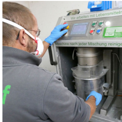
Befüllen der Misch- und Dosiermaschine