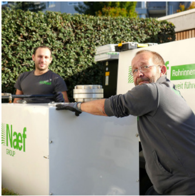
Gerätschaften für die Sanierung mit ANROSAN