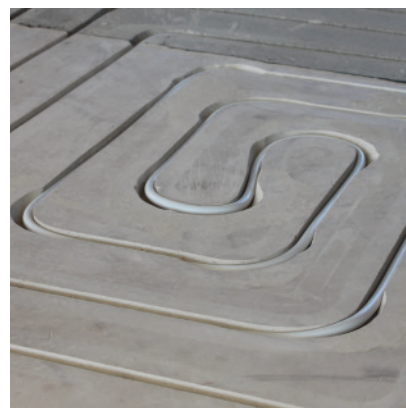
4 Die Einfräsetechnik ist die effiziente, saubere und günstige Art, nachträglich eine Bodenheizung, zu installieren oder eine bestehende Bodenheizung, die nicht mehr saniert werden kann, zu ersetzen.

Herr Näf, vielen Dank für das Gespräch. Wir wünschen Ihnen weiterhin alles Gute.