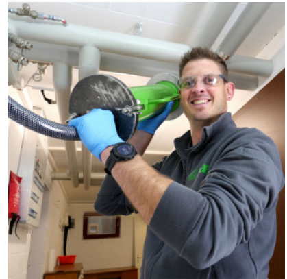
Gerätschaften für die Sanierung mit dem HAT-System | Mitarbeiter beim Sandstrahlen und anschließenden Beschichten der Leitungen